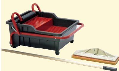
TKW 184 Tisztító medence