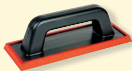
TKW 451 Gumi lehúzó